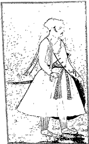
श्रीदत्ता-नरेण वीरसिंह देव